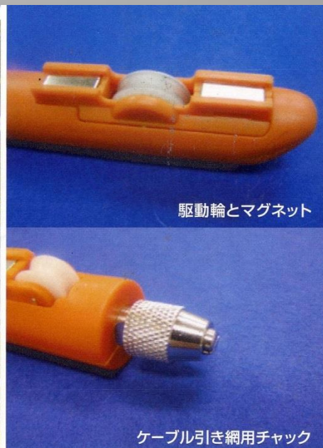
駆動輪とマグネット