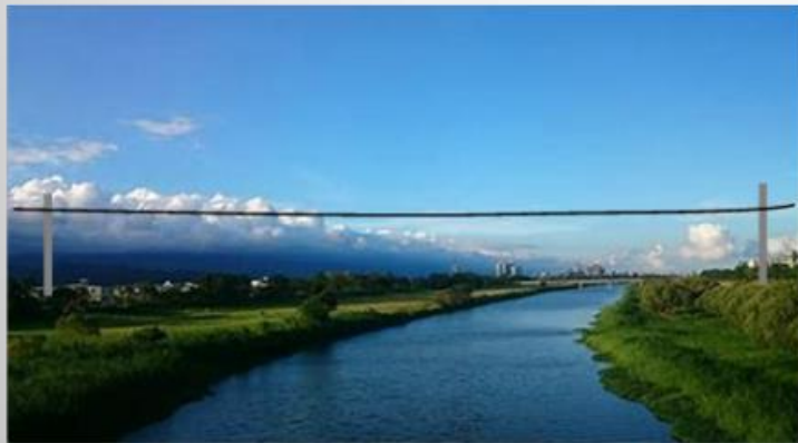
大きな河川の横断